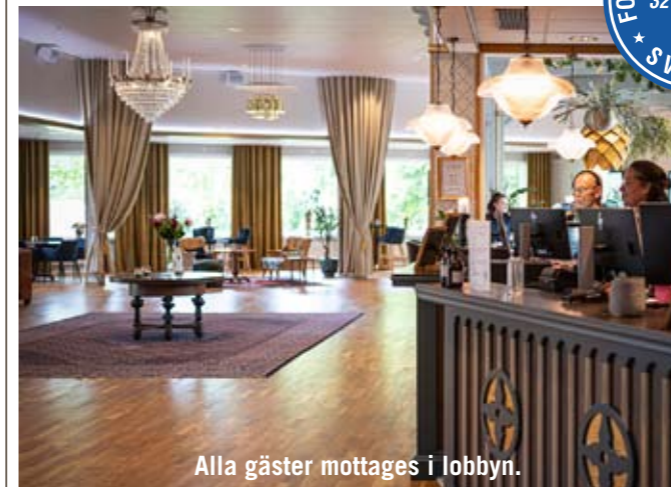
Alla gäster mottages i lobbyn.