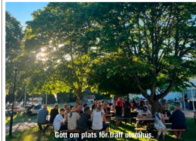
Gött om plats för träff utomhus.