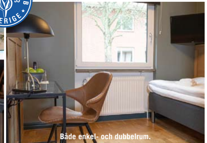
Både enkel- och dubbelrum.